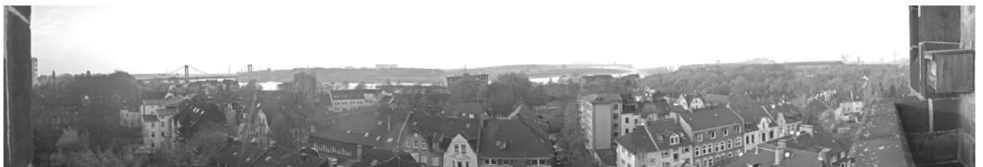
Laar vom Kirchturm nach Westen